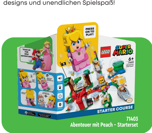
71403 Abenteuer mit Peach - Starterset

Machen Sie sich bereit für neue Action mit und um den neuen Charakter LEGO® Peach! Ab sofort können Kinder gemeinsam mit ihren Freunden und Familie neben LEGO Mario und Luigi, auch mit LEGO Peach Abenteuer erleben und gemeinsame Herausforderungen meistern! Zusätzliche Erweiterungssets ermöglichen dabei noch mehr Level-Designs und unendlichen Spielspaß!