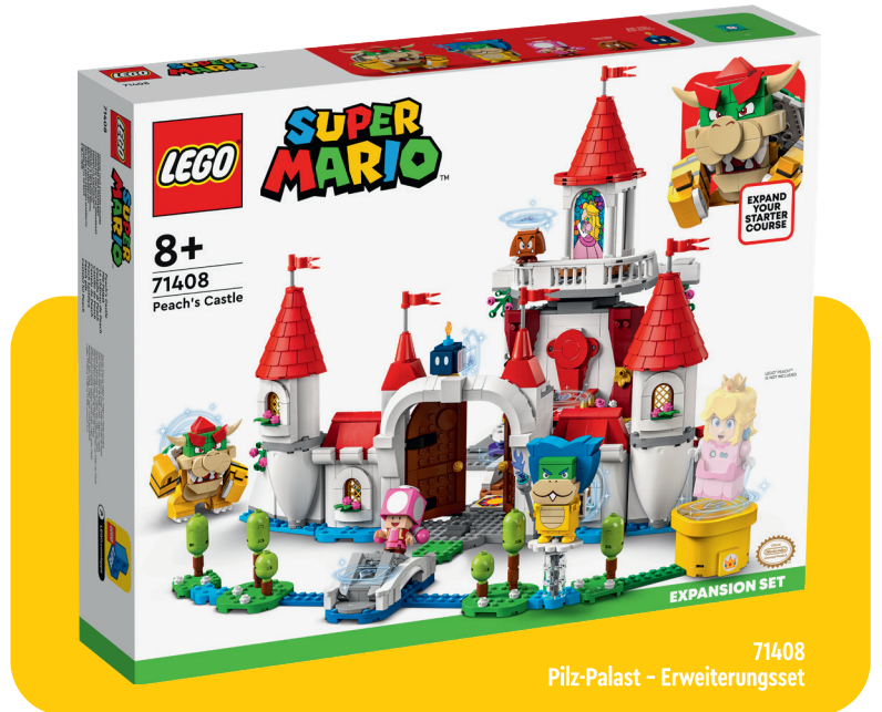
8+ 71408 Peach's Castle 81408 Pilz-Palast - Erweiterungsset

LEGO, das LEGO Logo und die Minifigur sind Marken der LEGO Gruppe. ©2022 The LEGO Group. TM & ©2022 NINTENDO