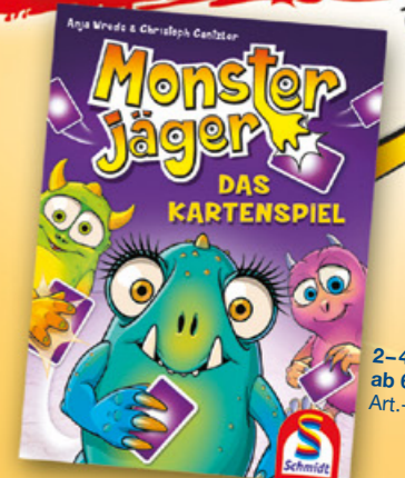
2-4 Spieler ab 6 Jahren Art.-Nr. 40635