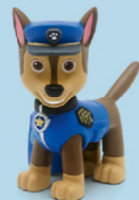
Paw Patrol® - Die Rettung der Meeresschildkröten