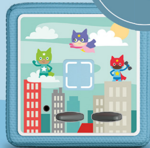
Dekofolie - Heldenstadt 5 weitere Motive erhältlich

Eine Zeit voller Fantasie erwartet euch auf tonies.com