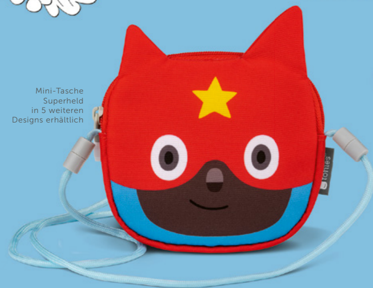
Mini-Tasche Superheld in 5 weiteren Designs erhältlich