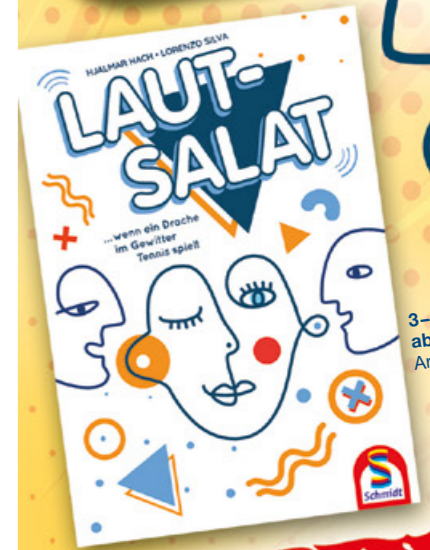
3-7 Spieler ab 8 Jahren Art.-Nr. 49425