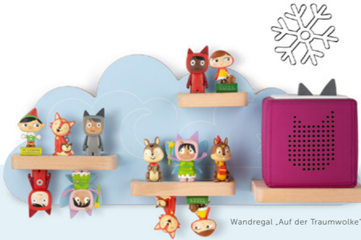
Wandregal „Auf der Traumwolke“

Eine Zeit voller Fantasie erwartet euch auf tonies.com